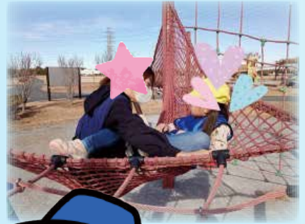
ピックアッププログラム